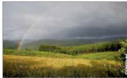
• Saint-Hubert - Forêt