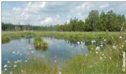
• Saint-Hubert - Forêt

Le haut-plateau bénéficie d'un relief peu accentué. Il se partage entre d'importants massifs boisés, principalement de feuillus, et des zones à caractère fagnard. Ces caractéristiques en font une zone inhabitée, mais d'une richesse inestimable en termes de biodiversité.