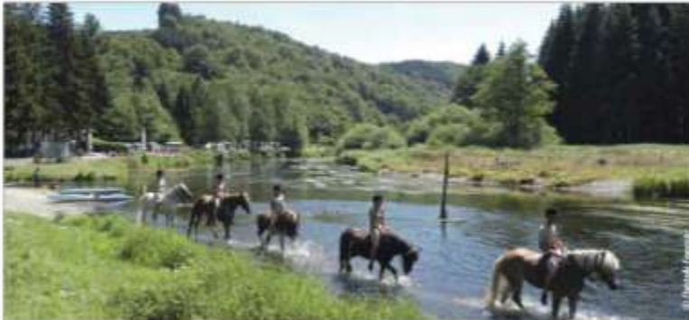
• Équitation au Mboué