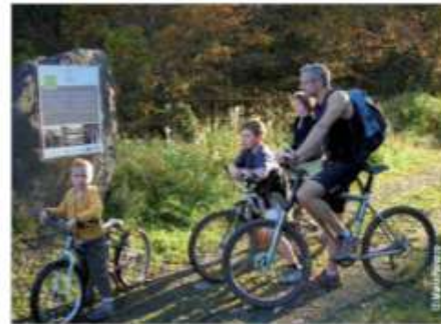
• Vélo Sentis